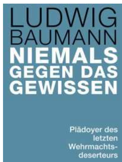
Buchcover Ludwig Baumann: Niemals gegen das Gewissen (Herder Verlag)

Er wurde 1921 geboren und ist der letzte noch lebende deutsche Deserteur des Zweiten Weltkriegs. Diesen erfuhr Ludwig Baumann als große Demütigung, als Zerstörung seiner Würde. Und rückblickend stellt er fest, die Zeit heile nicht alle Wunden.