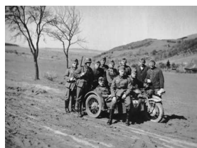
Kradfahrer und Soldaten haben sich zu einem Gruppenfoto in Frankreich aufgestellt - Herbst 1940.

URL dieser Seite: http://www.deutschlandradiokultur.de/kurz-und-kritisch-wie-drei-maenner-den-krieg-erlebten.1270.de.html?dram:article_id=285683