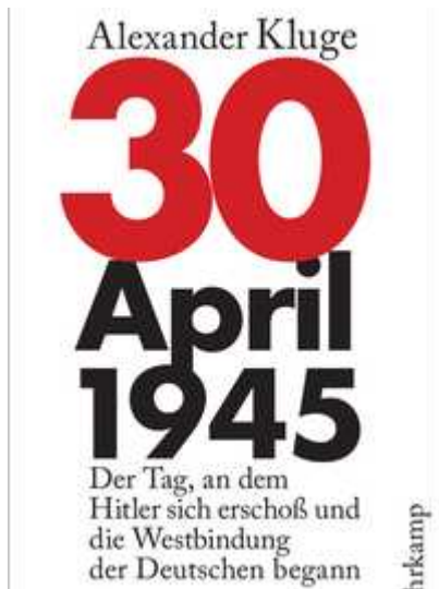
Buchcover Alexander Kluge: 30. April 1945 (Suhrkamp Verlag)

Die meisten ahnten nicht, welche Bedeutung dieser Tag haben würde, vielen aber ist dieser 30. April und das damit verbundene Zeitgeschehen bis heute präsent: