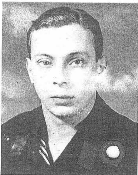
Todesstrafe: Herbert Burmeister

„Deserteure und andere Verfolgte der NS-Militärjustiz. Die Wehrmichtsgerichtsbarkeit in Hamburg“ 25.1. bis 15.2.2013; Rathausdiele im Rathaus, Rathausmarkt, Mo–Fr 9.00–18.00, Sa/So 10.00–13.00, Eintritt frei; Veranstaltungen hierzu unter www.kz-gedenkstaette-neuengamme.de