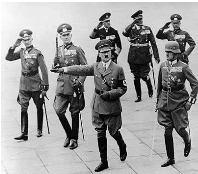
היטלר במצעד צבאי. באומן לא הסכים למדיניותו

"אני לא הסכמתי מהרגע הראשון לשאיפה של היטלר להגדיל את 'מרחב המחיה' של העם הגרמני", הוא מסביר. "אני זוכר היטב את התקופה בבית הספר שבה היו מלמדים אותנו שהגרמנים הם בני הגזע העליון ושיש גזעים נחותים מאיתנו שאינם ראויים להמשיך להתקיים. היה לי ברור שאת החלוקה ההיררכית בין הגזעים השונים אני לא מקבל. הבנתי שיש משהו שגוי בתפיסת העולם הזו".