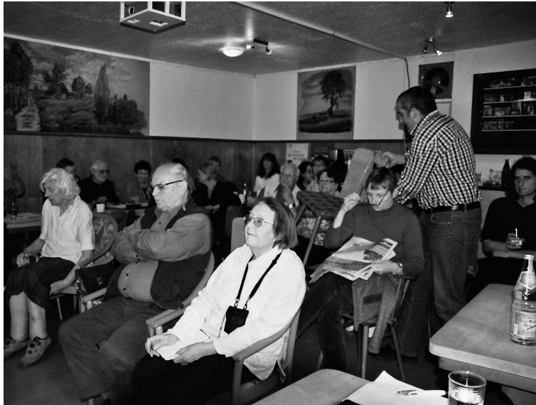
gut besuchte Mitgliederversammlung in Heideruh

Sudanesen aufgenommen. In den Berichten der Geschäftsführung konnte festgehalten werden, dass sich nach langem Ringen die Finanzsituation stabilisiert und Heideruh als Erholungs- und Begegnungsstätte gerettet ist.