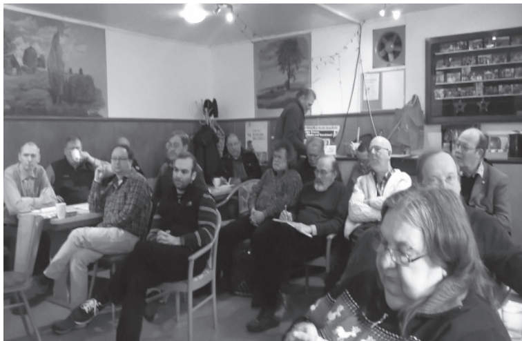
Zum Thema hatten alle etwas beizutragen

sich auf das Blutrecht der Romantik, um den seit inzwischen seit drei oder mehr Generationen Ansässigen das Existenzrecht in Deutschland abzusprechen.