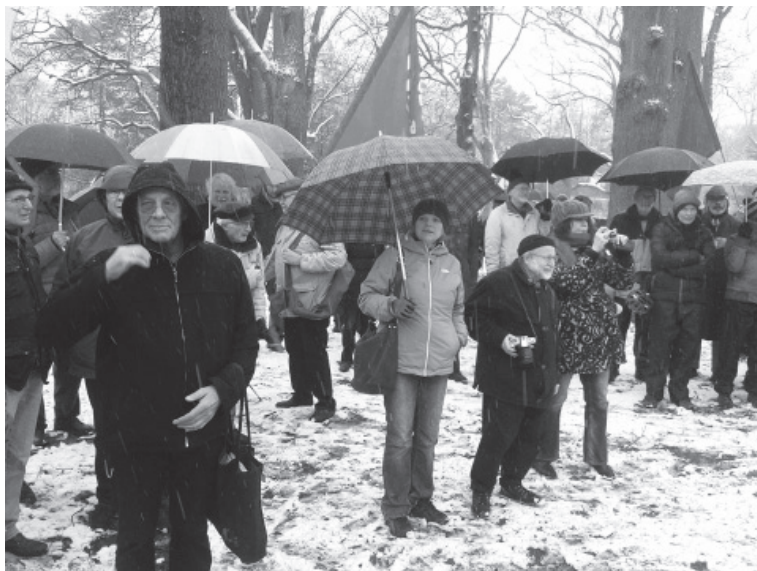
Trotz Wind und Wetter eine höhere Beteiligung

Am 14.02.2016 fand auf dem Waller Friedhof in Bremen wie in jedem Jahr eine kleine Gedenkfeier zur Ehrung und Erinnerung der bei der Niederschlagung der Bremer Räte-Republik durch das Militär des so genannten "Freikorps Caspari" im Auftrag der SPD-Regierung unter Friedrich Ebert (Befehlshaber war Kriegsmminister Gustav Noske) Getöteten statt. Unter den Delegationen der verschiedenen Parteien waren Vertreter der DKP, der MLPD, der Partei Die Linke Bremen, verschiedener Opfer-Verbände. So versammelten sich bei eisigen Temperaturen immerhin ca. 120 Menschen, die die vielen Toten wie z.B. Johann Knief und deren Eintreten für eine bessere Welt und menschenwürdige Lebens- und Arbeits-Bedingungen mit ihrem Erscheinen ehren wollten.