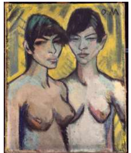
„Zwei weibliche Halbakte“ von Otto Müller