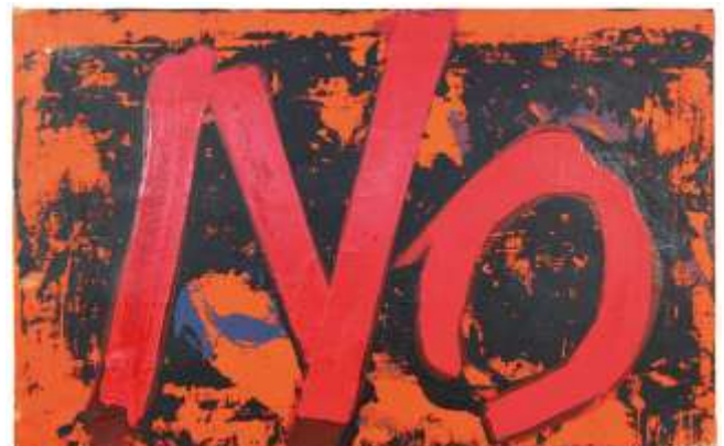
Boris Lurie, 1963 / Feel-Painting-NO with Red

Ort: EL-DE-Haus, Treffpunkt Museumskasse Eintritt: 4,50 Euro, erm. 2 Euro