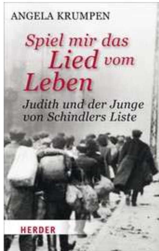
Abbildung Buchumschlag: © Herder Verlag

Sie beginnt, sich für die Geschichte des Holocaust und seiner Überlebenden zu interessieren. Eines Tages treffen sich Judith und Herr Emge, der als einziges Kind auf der Liste Oskar Schindlers stand und einst selbst Violine spielte. Diese Begegnung wird beide verändern.