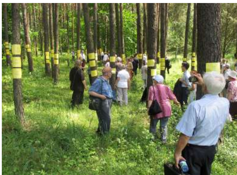
Namensschilder im Wald von Blagowschtschina zur Erinnerung an die hier Ermordeten.

Zu Beginn dieser Gedenkveranstaltung sprach der ehemalige Bremer Bürgermeister, Dr. Henning Scherf. Er sagte: „Verdrängung und Vergessen haben lange Zeit das Verhältnis der deutschen Gesellschaft zu den Gräueln des Zweiten Weltkriegs bestimmt. Es hat lange gedauert, bis wir uns unserer historischen Verantwortung gestellt haben. Die Vergangenheitsbewältigung war wichtig und notwendig, so schmerzlich und bitter sie zuweilen auch war. Heute, 70 Jahre nach den unmenschlichen Verbrechen, ist die Versuchung groß, die Auseinandersetzung mit dem Holocaust für abgeschlossen zu erklären. Genährt wird dieser Wunsch durch den trügerischen Schluss, wir wüssten schon alles über den Holocaust und hätten kein Opfer vergessen.“