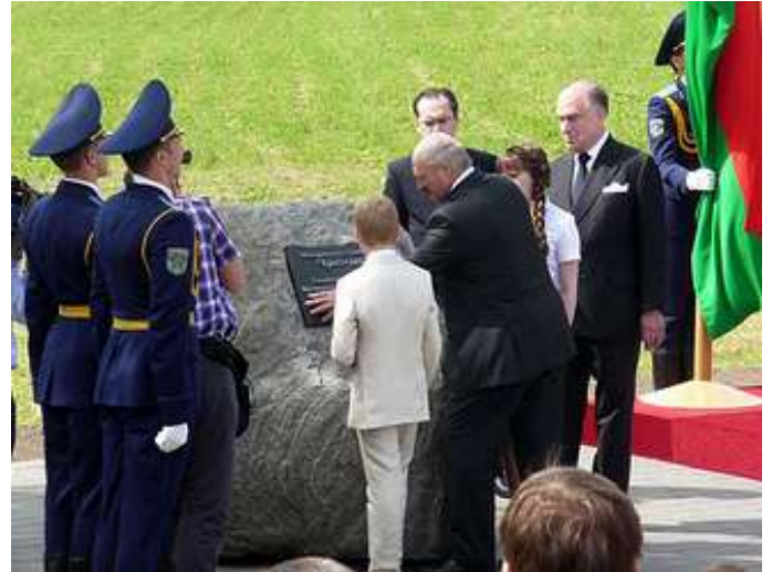
Grundsteinlegung durch den Staatspräsidenten Alexander Lukaschenko, rechts der Präsident des jüdischen Weltkongresses, Ronald S. Lauder.

Am 8. Juni 2014 (Pfingstsonntag) war es nach langer Vorbereitung soweit. Der belarussische Staatspräsident Alexander Lukaschenko legte selbst den Grundstein für die Holocaust-Gedenkstätte Maly Trostenez / Minsk, in Anwesenheit des Präsidenten des jüdischen Weltkongresses, Ronald S. Lauder. Bei diesem staatstragenden Akt durfte der kleine Präsidentensohn die Metallhülle mit Dokumenten in den vorbereiteten Grundstein einlassen.