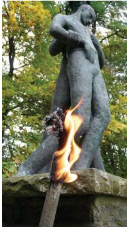
Titelbild des Tagungs-Flyers

Nach 1945 blieb der Hürtgenwald mit seinen Gemeinden über viele Jahre von dem Kriegsgeschehen gezeichnet. Noch heute finden sich in den Wäldern Kriegsrelikte: gesprengte Bunker, überwachsene Laufgräben, gefährliche Blindgänger.