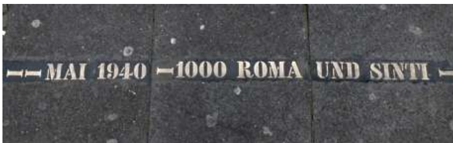
Spur Sinti und Roma am Dom, Westseite

Eine weitere Spur finanziert der Verein EL-DE-Haus e.V., Förderverein des NS-DOK.