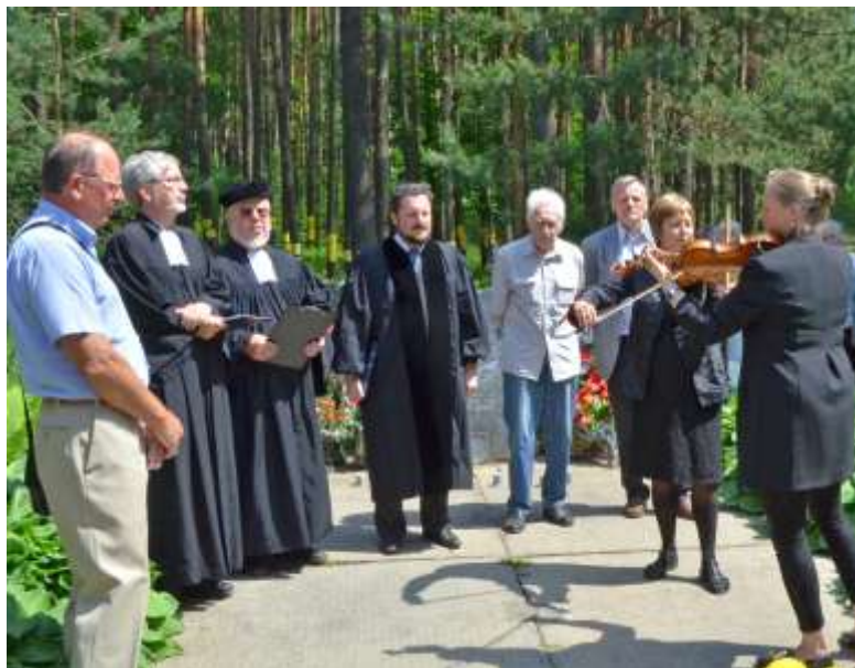
Gedenkfeier in Blagowschtschina, dem Vernichtungsort vieler Juden.