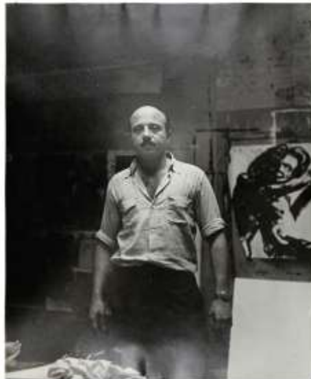
Boris Lurie

Ort: Filmhauskino, Maybachstraße 111, 50670 Köln Eintritt beide Filme: 9 Euro, erm. 7,50 Euro Eintritt Filme einzeln: 6,50 Euro, erm. 5 Euro