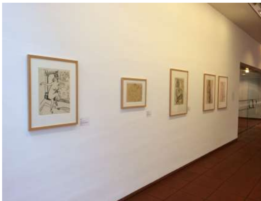
Ausstellung 2013 restituerter Papierarbeiten im Museum Ludwig.