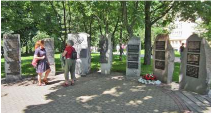
Minsker Gedenkort: Mahn- und Erinnerungsort an die in Minsker ermordeten europäischen Juden.

Für das NS-Dokumentationszentrum der Stadt Köln stellte Dr. Jung die erfolgreiche Arbeit vor, die auf großes Interesse auch bei jungen Menschen stieß.