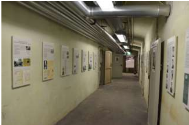
Foto: Blick in die Dauerausstellung im "Frauenhaus" der Gedenkstätte Brauweiler