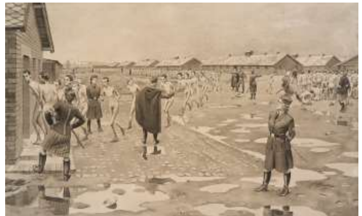
Zeichnung: Władysław Siwek, Im Frauenlager