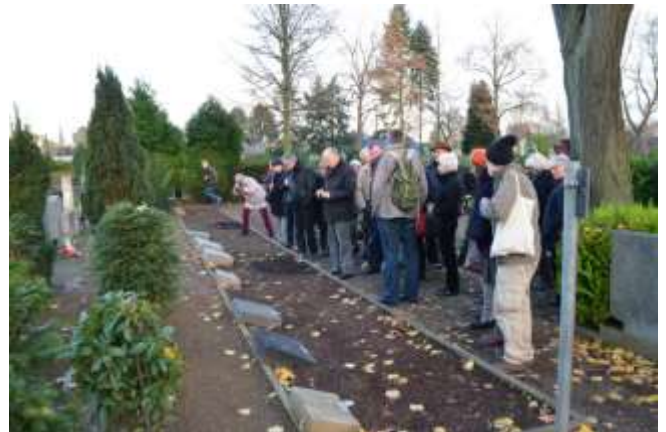
Foto: Besuchergruppe am Gräberfeld "Gestapo-Opfer" auf dem Friedhof Brauweiler