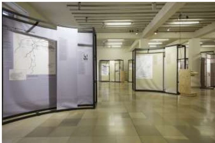
Foto aus der Ausstellung: NS-DOK Todesfabrik Auschwitz

„Auschwitz“ wird heutzutage universell als Metapher für die größten Verbrechen der Menschheit, begangen vom nationalsozialistischen Deutschland, verstanden. „Auschwitz“ gilt als Symbol für den Holocaust, den planmäßigen Mord an dem europäischen Judentum und ist ein bedeutender Erinnerungsort für Sinti und Roma.