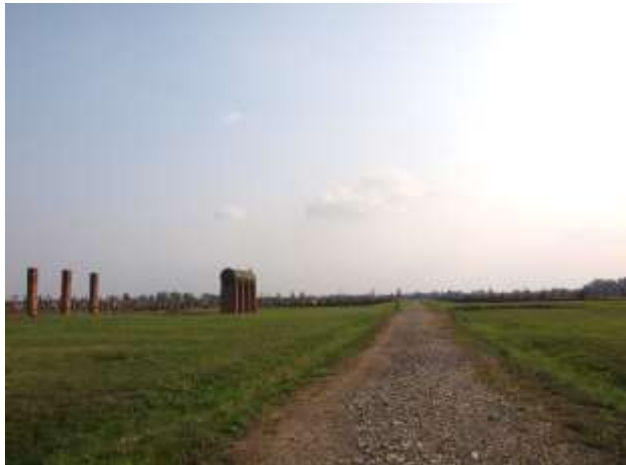
Foto: Wassertank im Männerlager, wo Hinrichtungen stattfanden