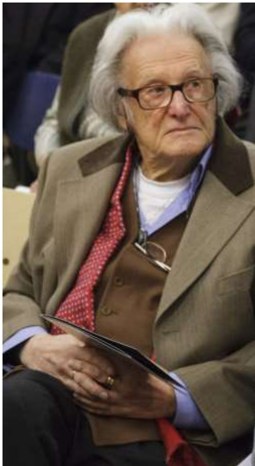
Ralph Giordano beim Festakt zum Ausbau und zur Erweiterung des NS-DOK am 2. Dezember 2012