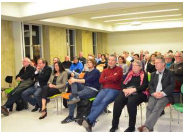
Foto: BesucherInnen der Preisverleihung im EL-DE-Haus