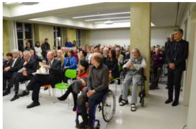
Foto: BesucherInnen bei der Ausstellungseröffnung © Dieter Marezky

Damit gibt es erstmals für ein Konzentrationslager eine umfassende Rekonstruktion des Lagerkomplexes sowie aller zentralen Gebäude.