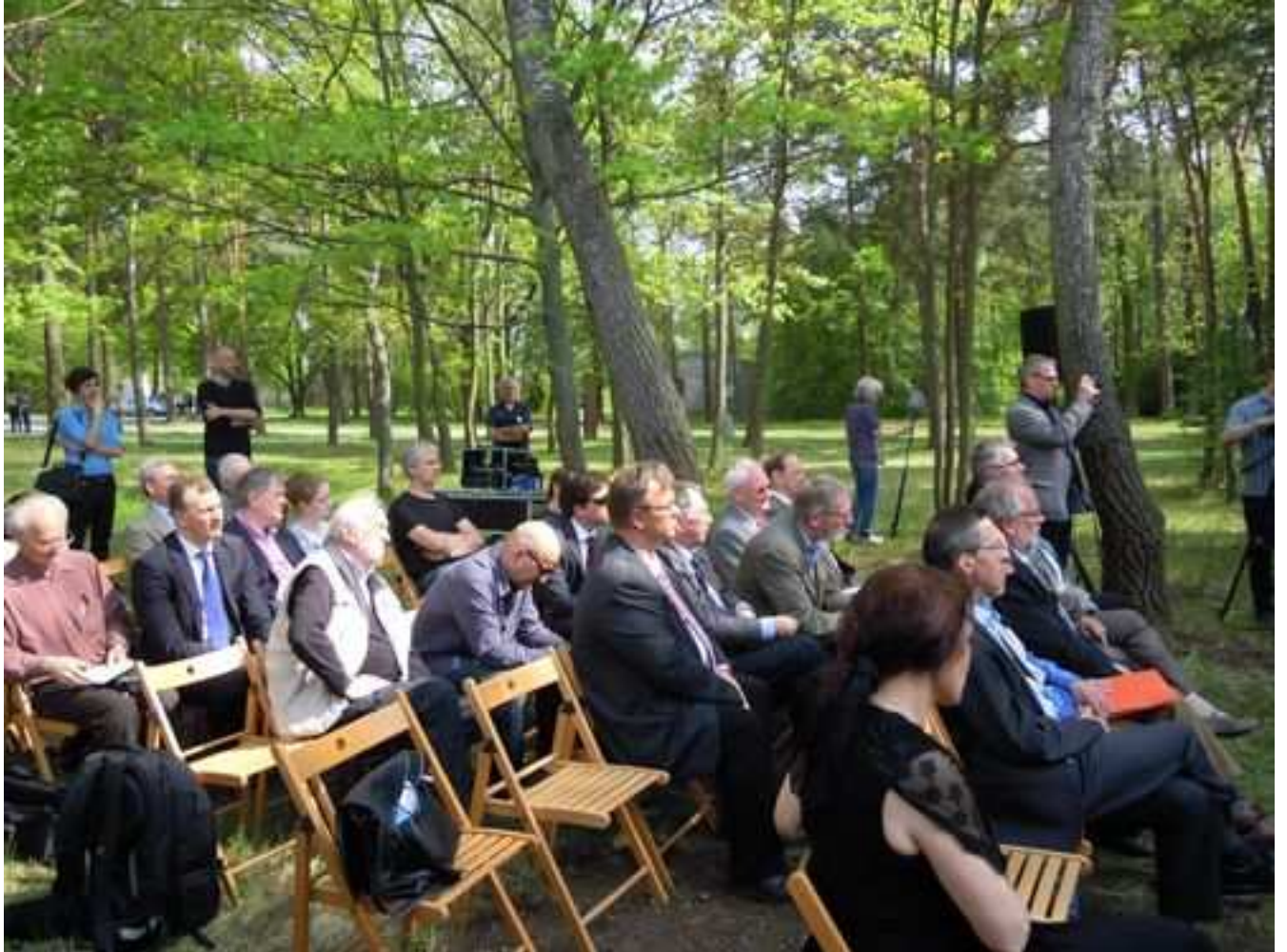
Ansprache vor der Enthüllung