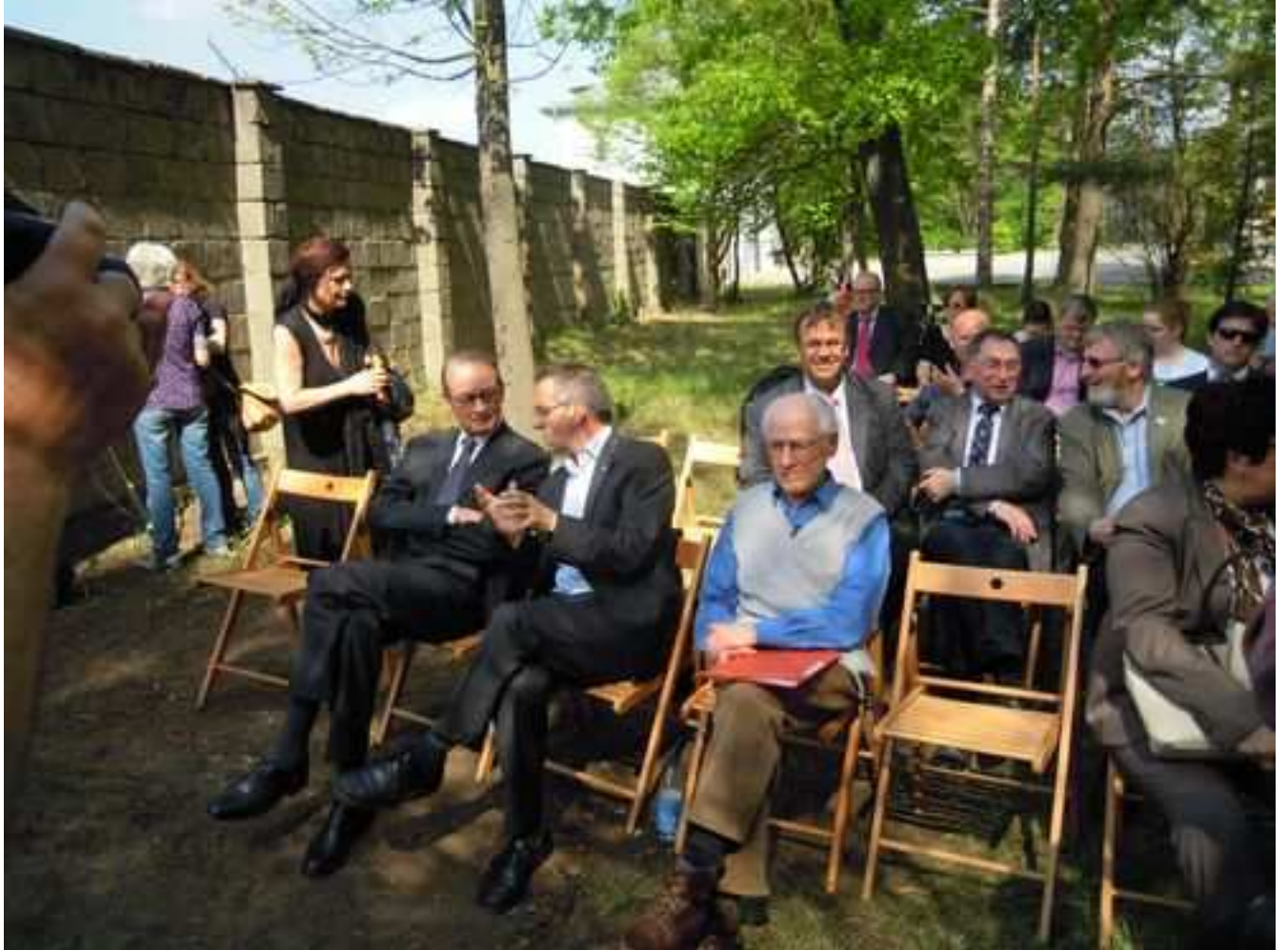
Versammlung vor der Außenmauer des Lagers