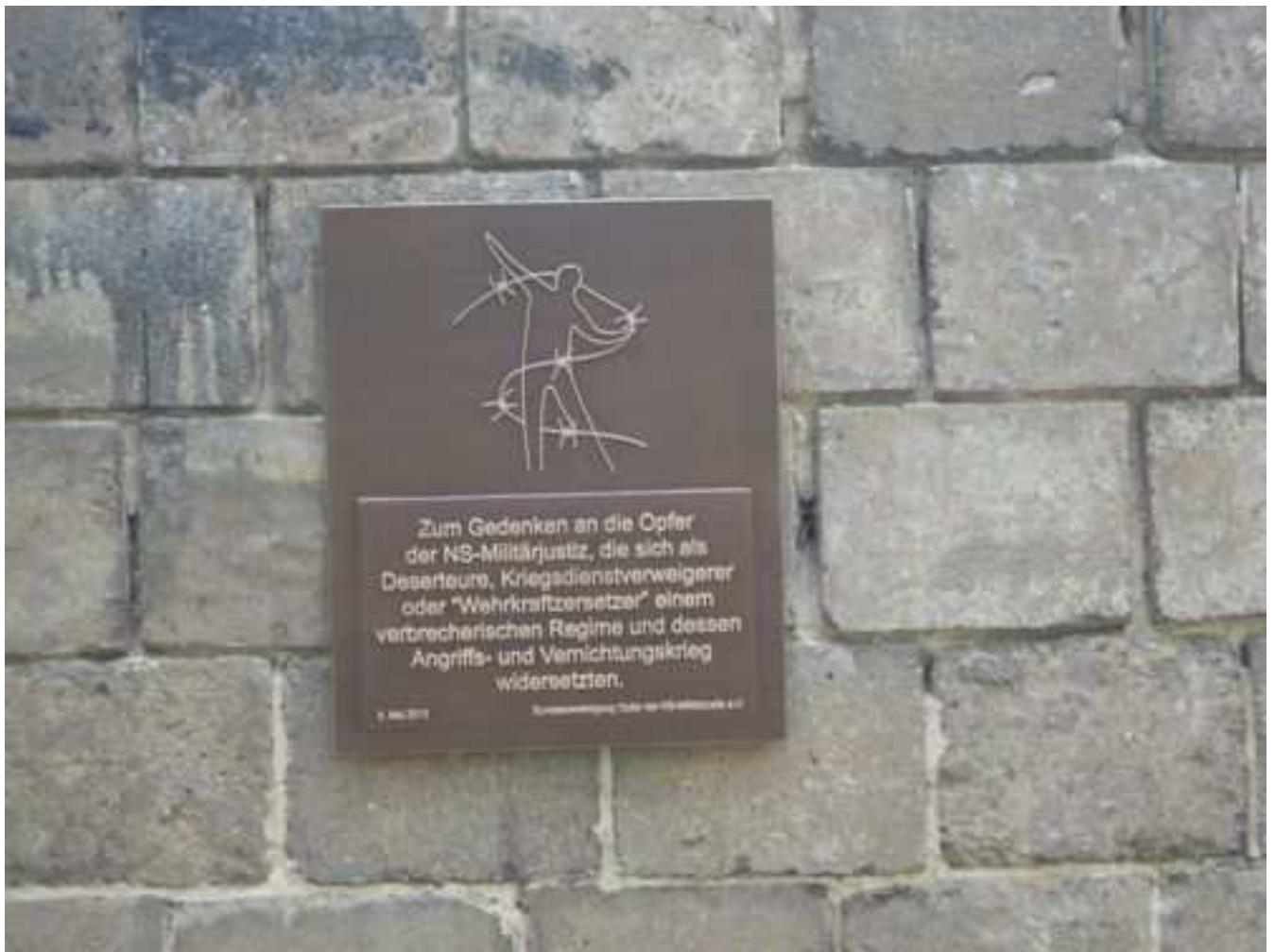
Die Gedenktafel (Bronze 60x50 cm)