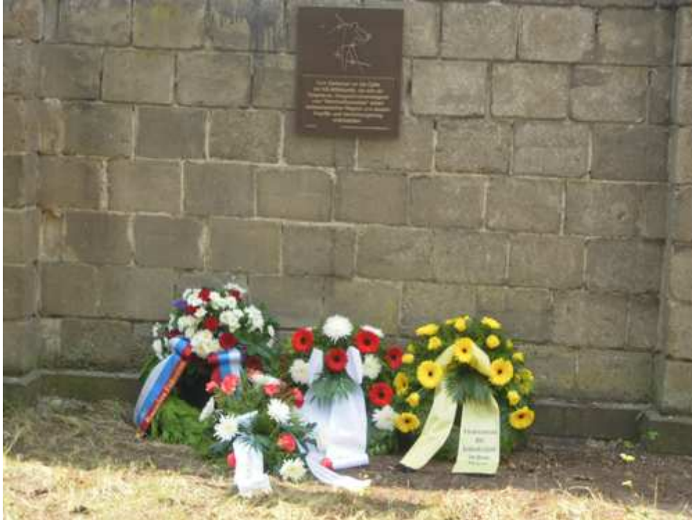
Gedenk-Kränze (vlnr): Botschaft Russlands; Internat. Sachsenhausen-Komitee; BV Opfer NS-Militärjustiz; Förderverein Gedenkstätte Sachsenhausen.