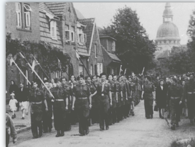
Marsch polnischer Pfadfinder durch die polnische Enklave Maczków/Haren (Ems) Foto, ca. 1945 – 1948; Privatbesitz Aleksandra Sekowska, Warschau

Seminar in Zusammenarbeit mit der Interessengemeinschaft niedersächsischer Gedenkstätten und Initiativen zur Erinnerung an die NS-Verbrechen