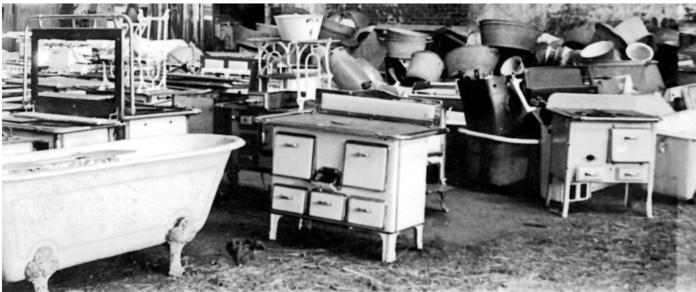
Bildnachweise: Sammellager für jüdischen Besitz, 1943, Quelle: Stadtarchiv Oberhausen.

Ab 14 Uhr stellen Historikerinnen und Historiker den jeweiligen Forschungsstand in Bezug auf die Profit-Trias Fiskus, Firmen und Privatleute dar. Besonderes Augenmerk liegt dabei auf der Frage, wie sich der heutige Umgang mit den